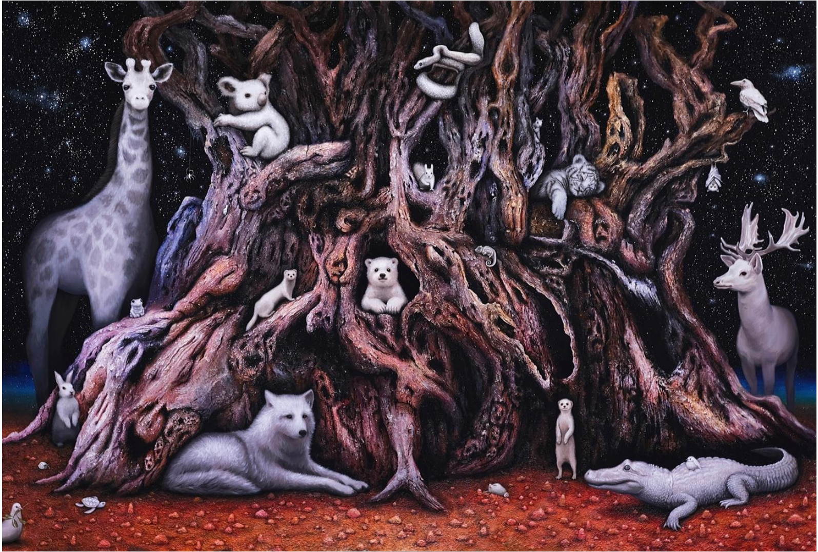
어느 밤에, 캔버스에 아크릴, 197 × 290.9 cm, 2023