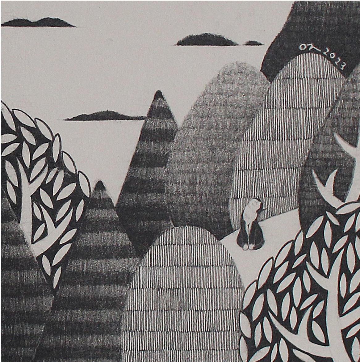
너와 함께 (feat. 오도 가는 길 no.4)