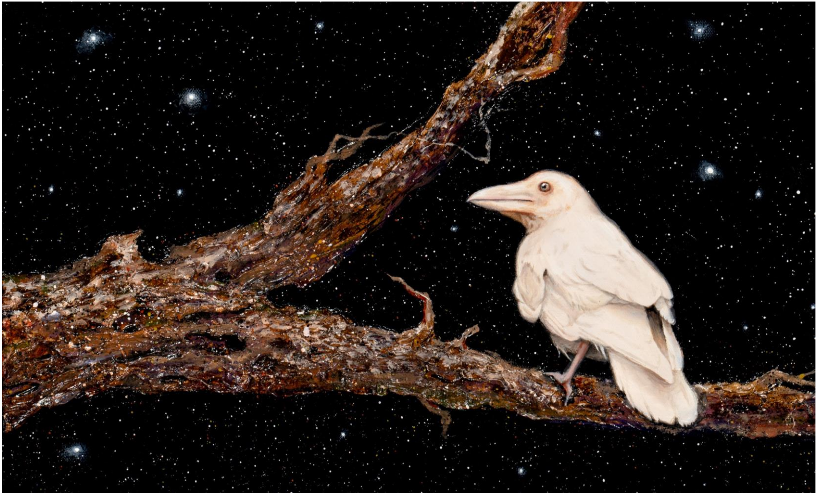
어느 밤에 , 캔버스에 유채, 33.4 x 53 cm, 2023