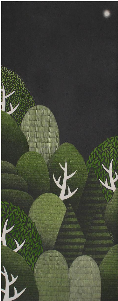
너와 함께 (feat. 오도의 밤 하늘 no.3)