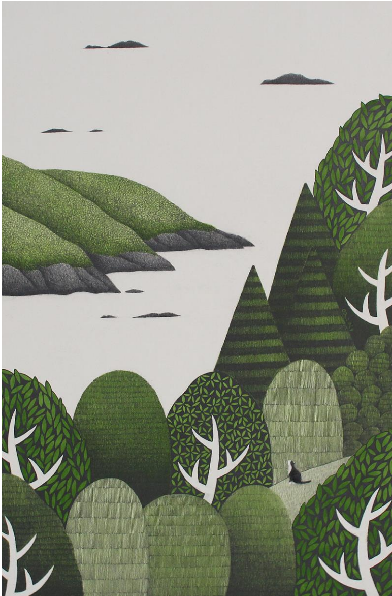
너와 함께 (feat. 칠포의 여름)