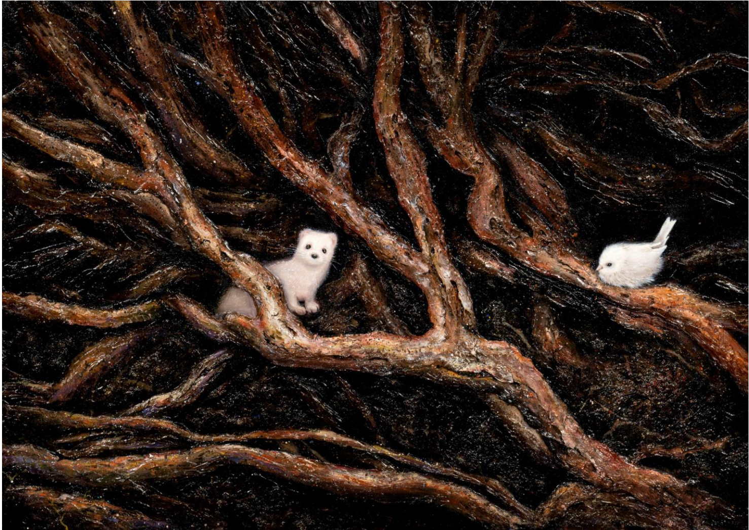
어느 밤에 , 캔버스에 유채, 65.1 x 90.9 cm, 2023