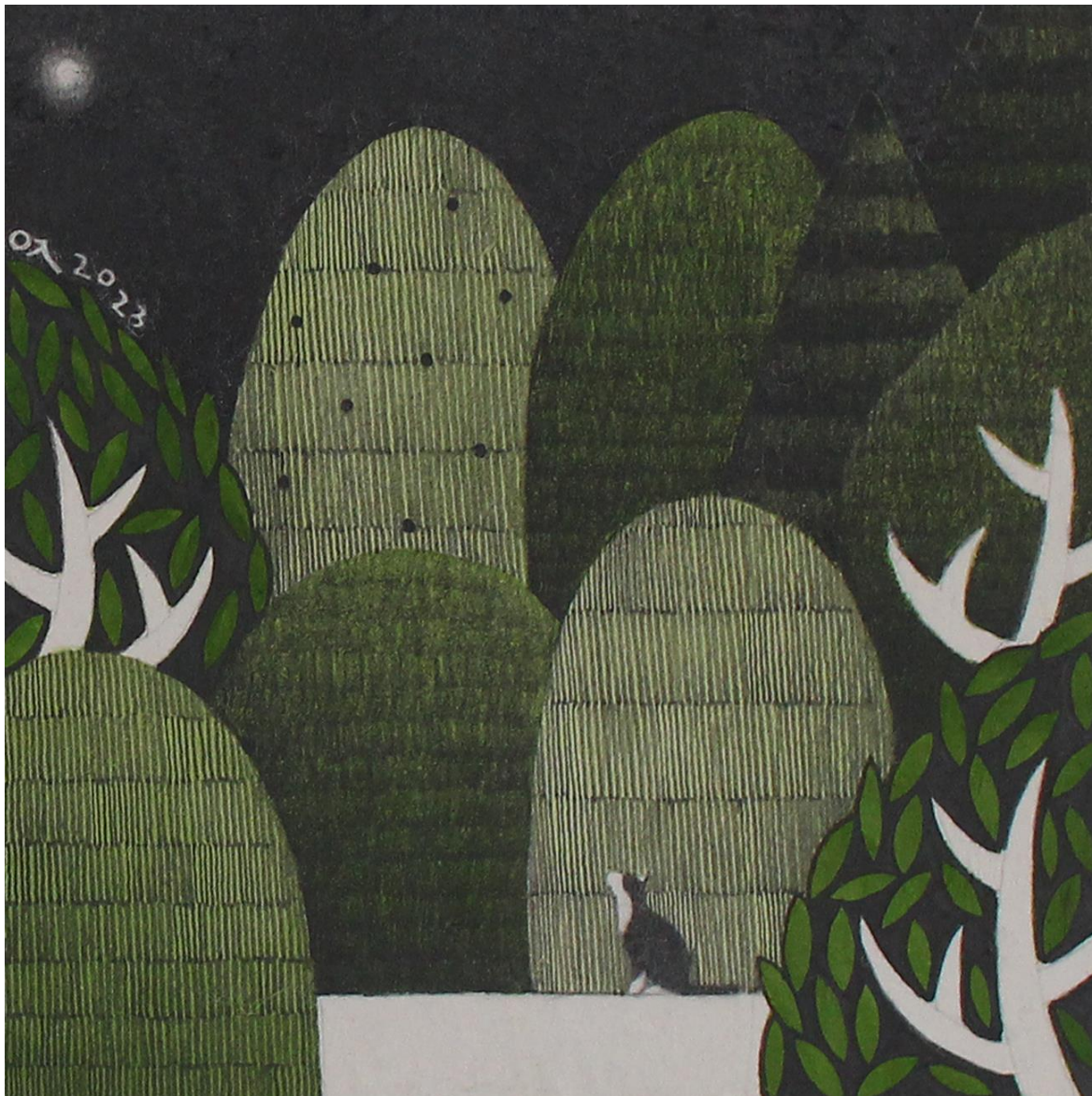
너와 함께 (feat. 달빛 호수 no.16)