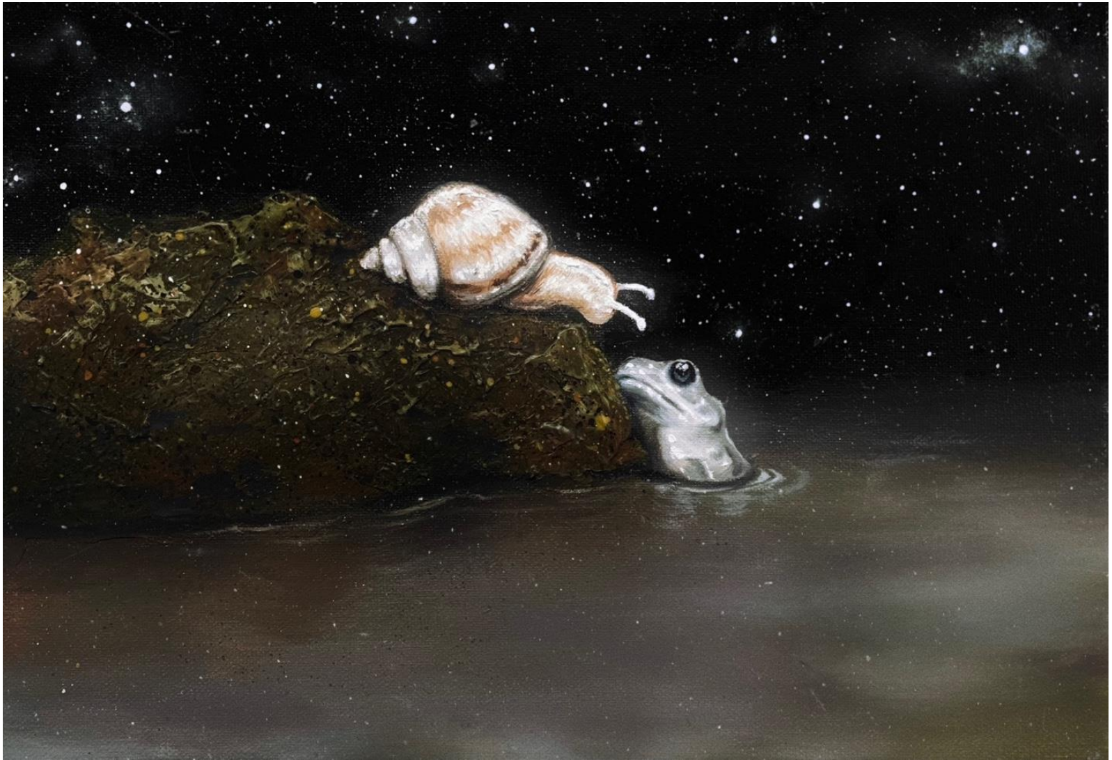
어느 밤에 , 캔버스에 유채, 24.2 x 34.8 cm, 2023