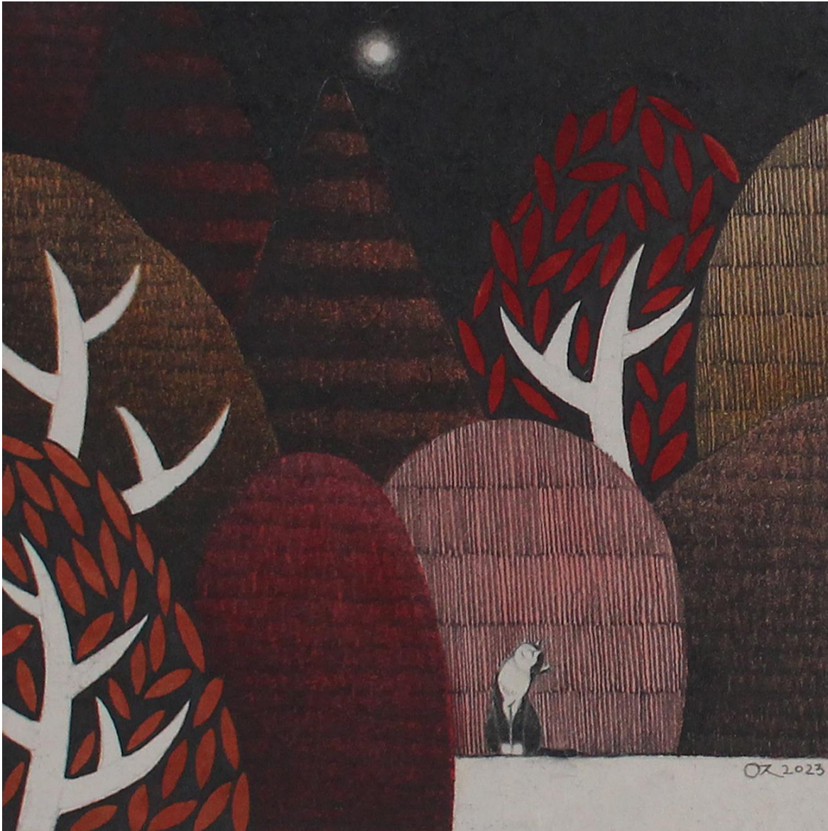
너와 함께 (feat. 가을 호수 no.2)