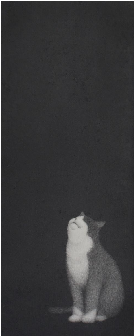
니가 온다카른 행복할끼라 no.3