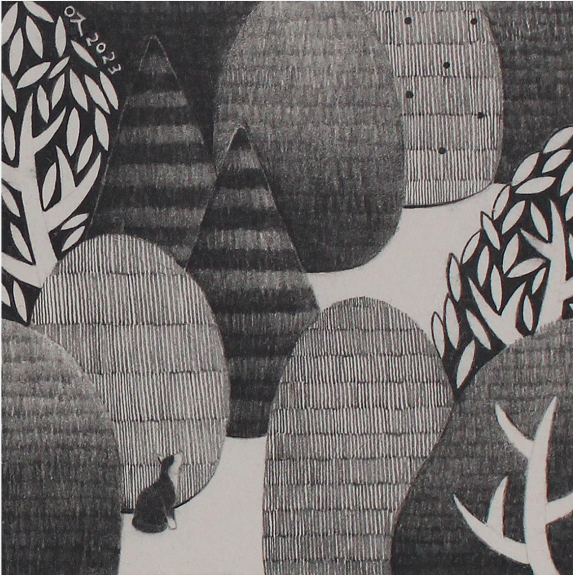
너와 함께 (feat. 콩밭 가는 길 no.2)