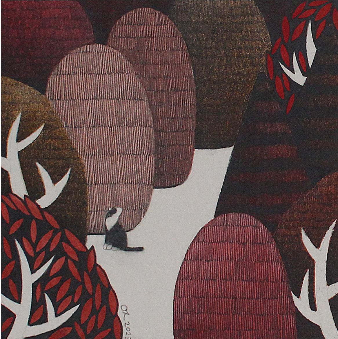
너와 함께 (feat. 오도의 가을 동산 no.2)