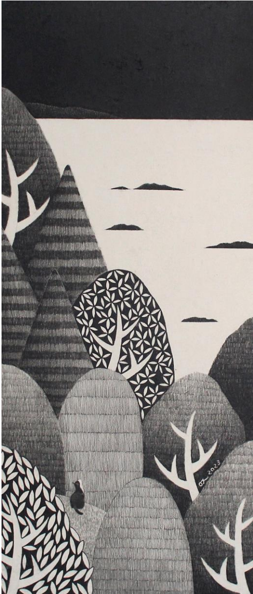
너와 함께 (feat. 오도의 밤바다 no.8-1)