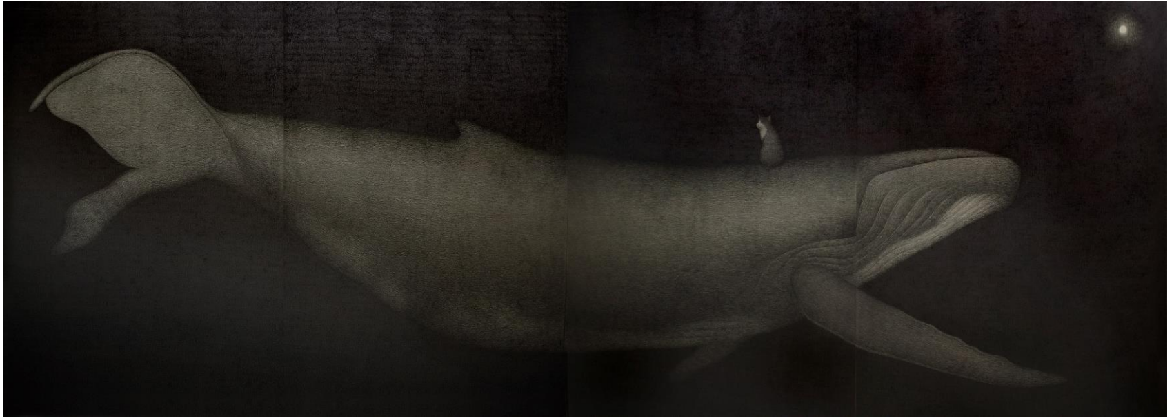
우린 다시 만났어 II , 한지에 혼합재료, 192 x 520 cm, 2022