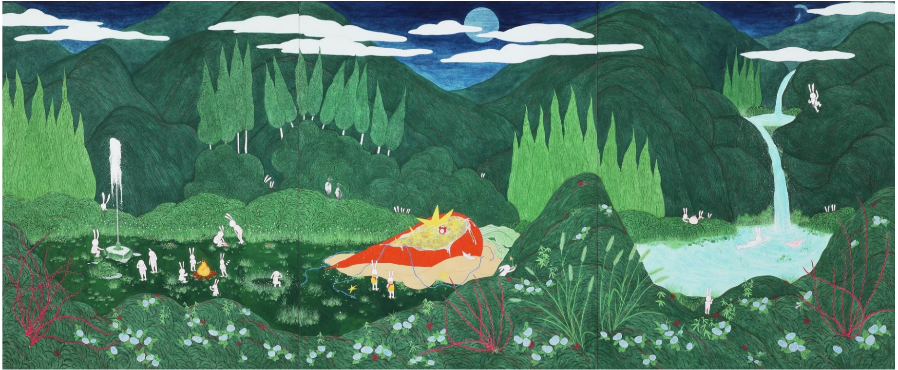
새벽의 환상, 장지에 호분과 분채, 162.2 x 390.9 cm, 2023