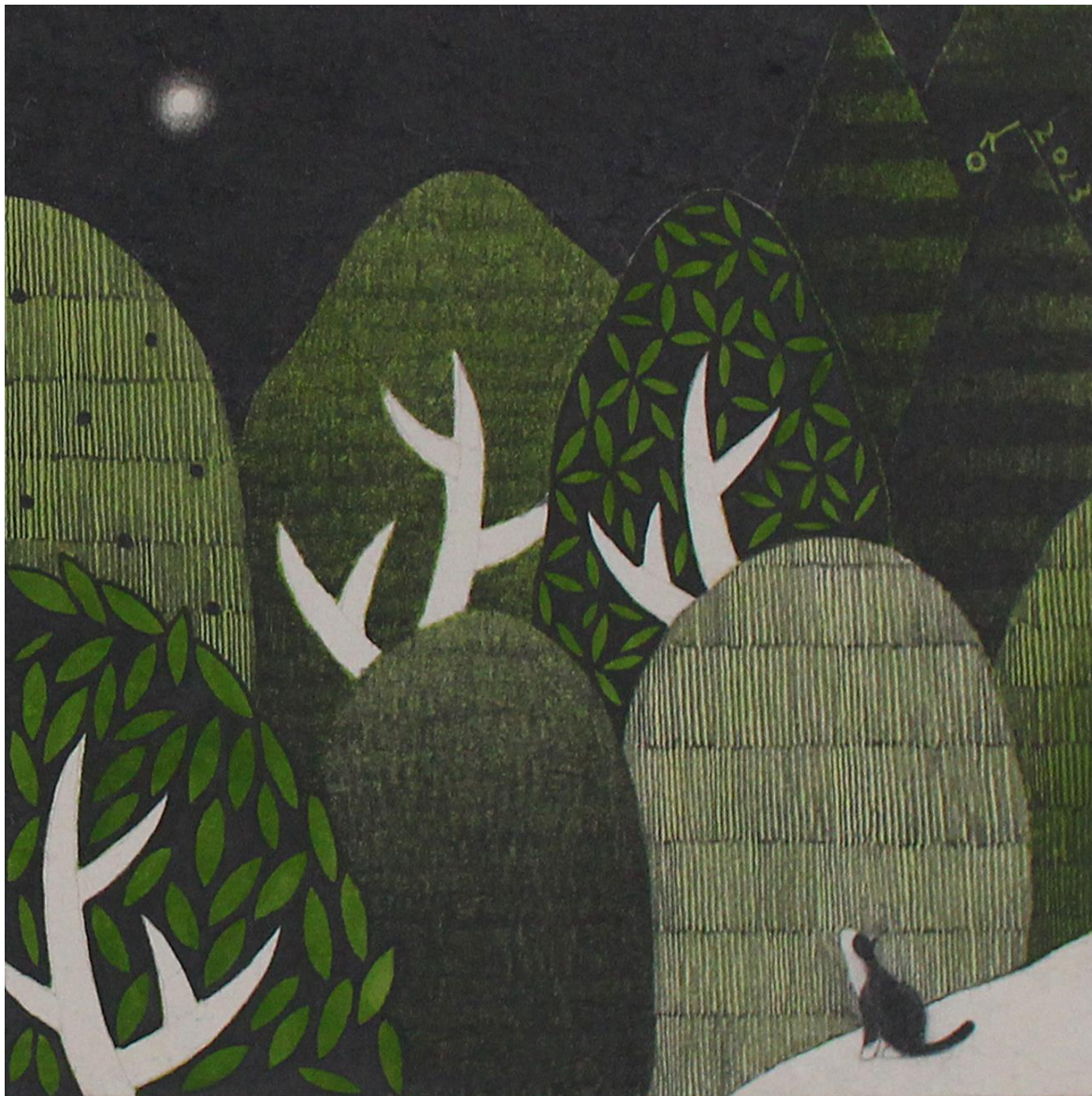
너와 함께 (feat. 오도의 밤하늘 no.4)