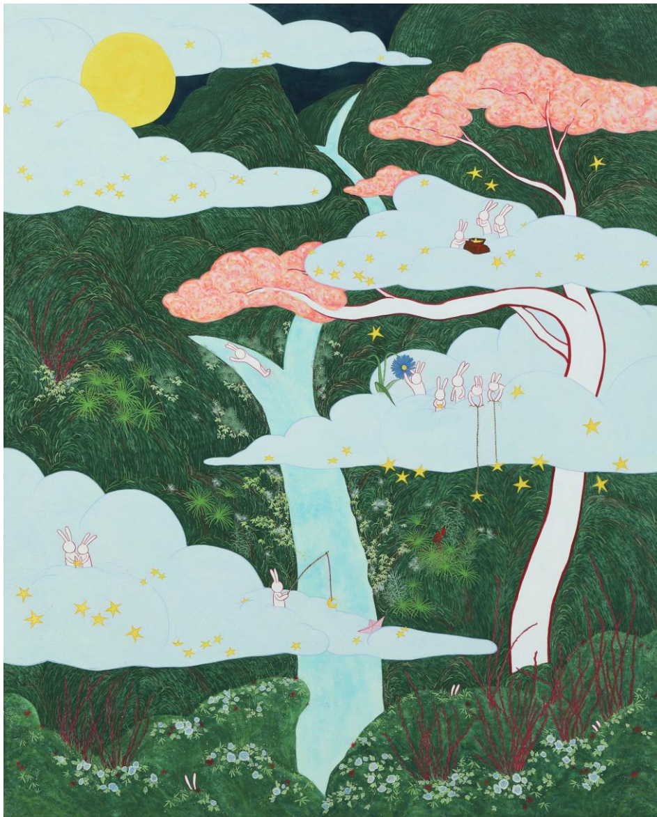
별을 위한 기도