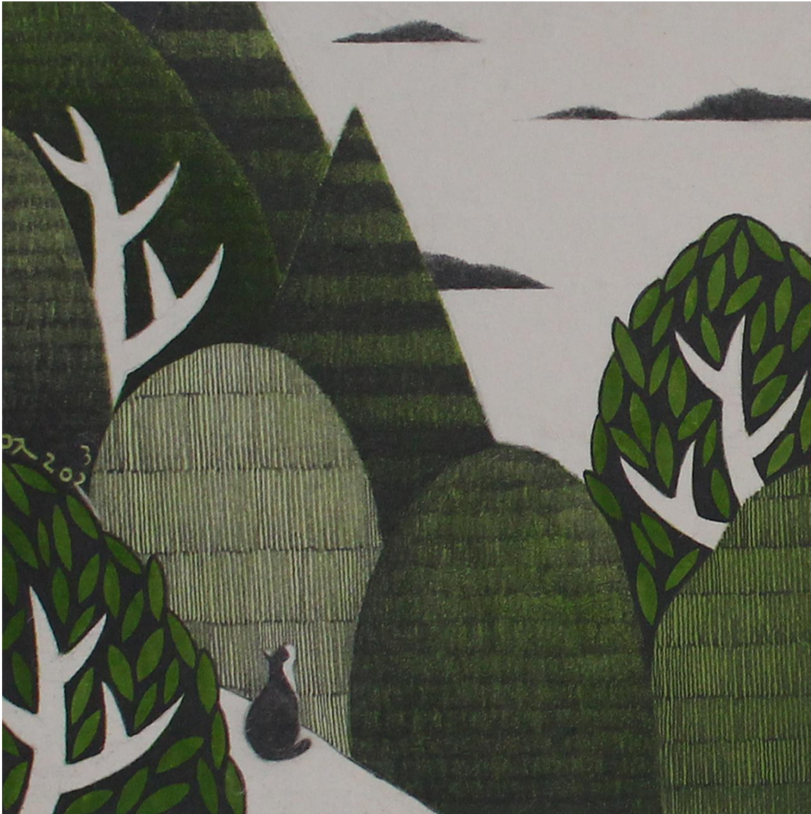
너와 함께 (feat. 오도 가는 길 no.3)