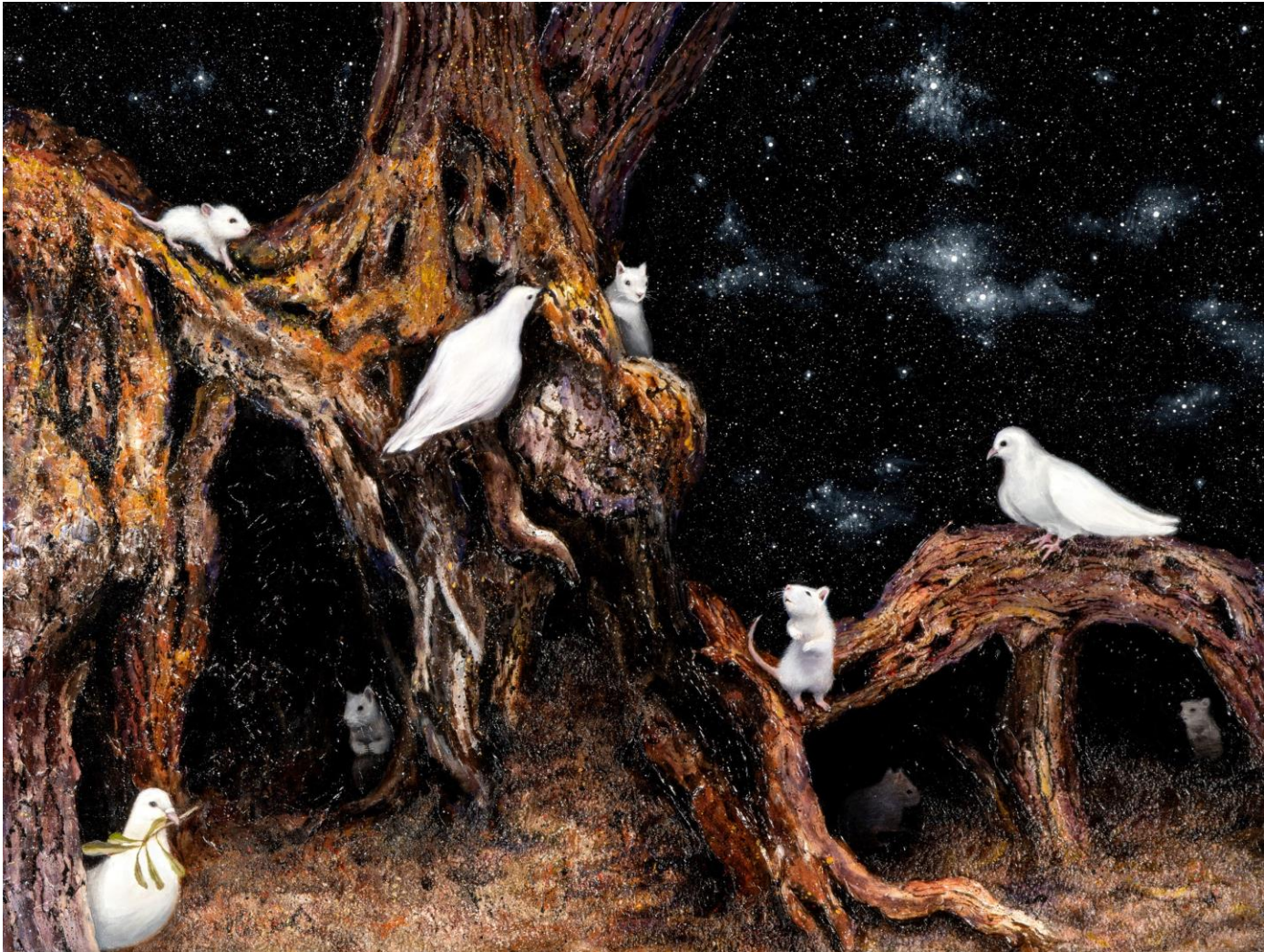
어느 밤에 , 캔버스에 유채, 91 x 116.8 cm, 2023