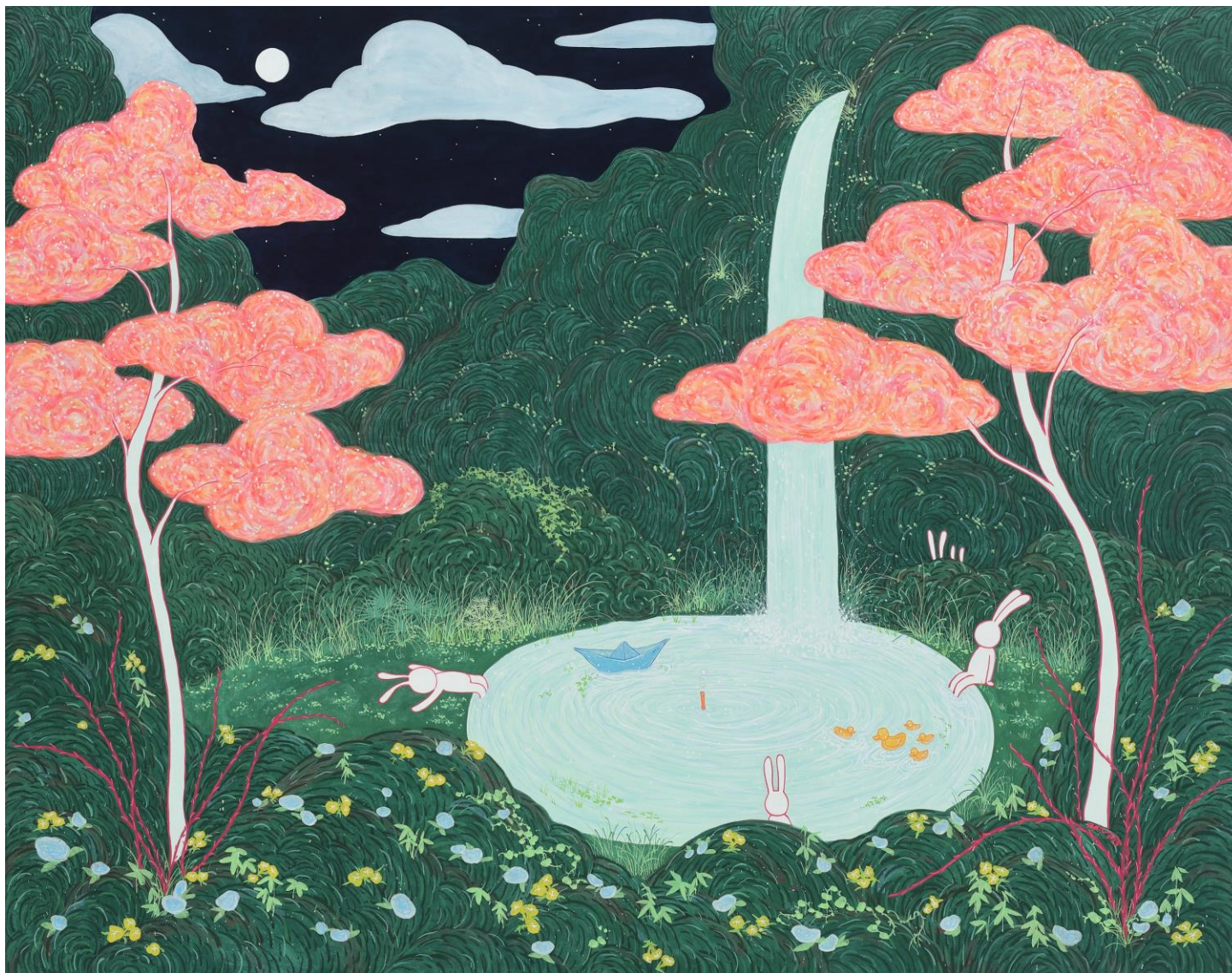
달빛 아래 , 장지에 호분과 분채, 91 x 116.8 cm, 2023