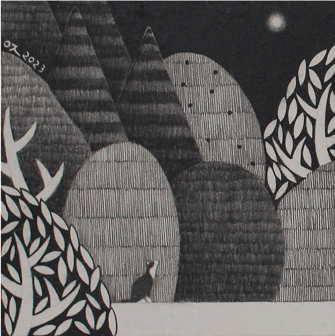
너와 함께 (feat. 달빛 호수 no.17)