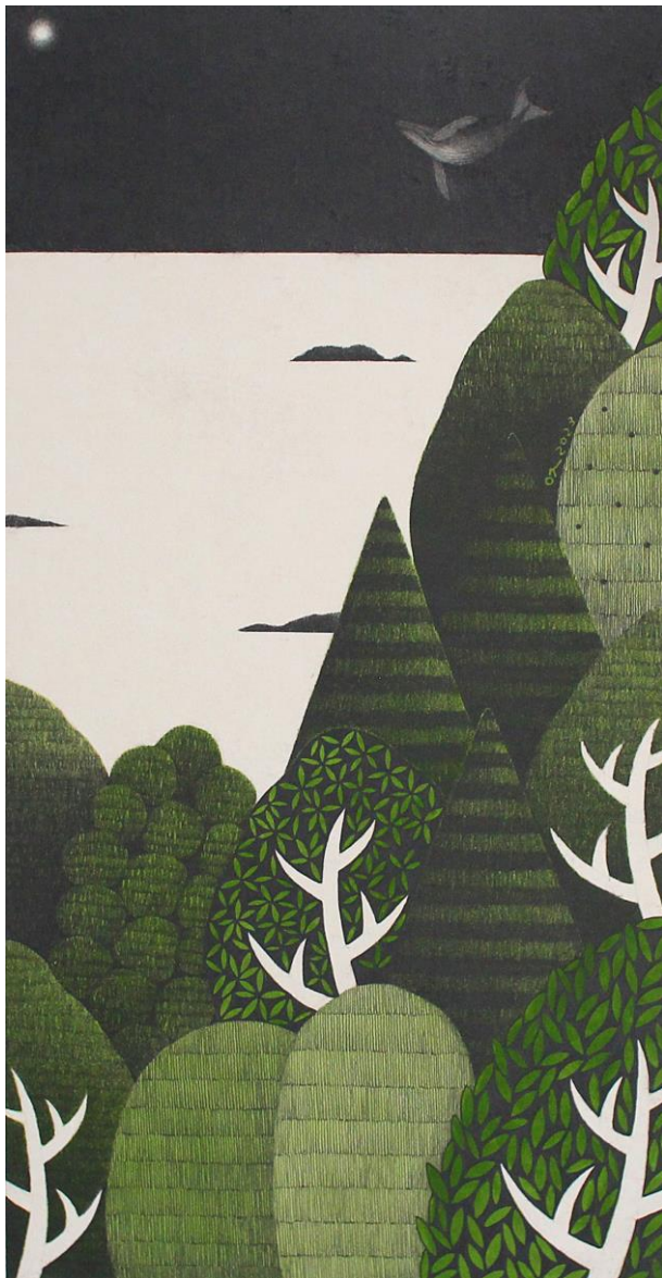
너와 함께 (feat. 오도의 밤바다 no.8-2)