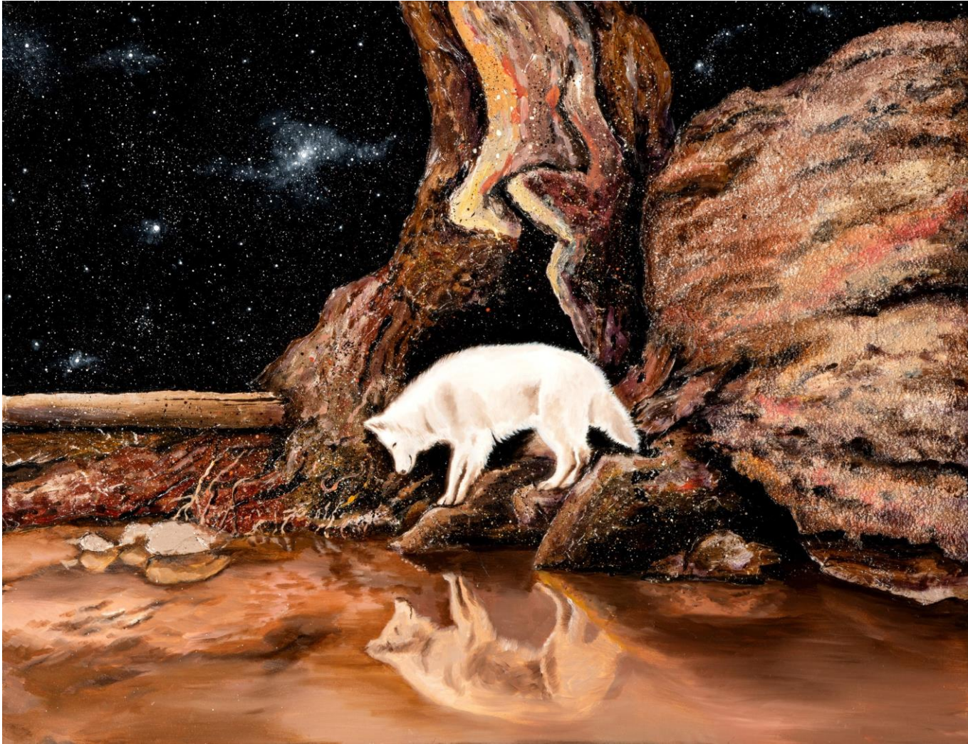
어느 밤에 , 캔버스에 유채, 91 x 116.8 cm, 2023